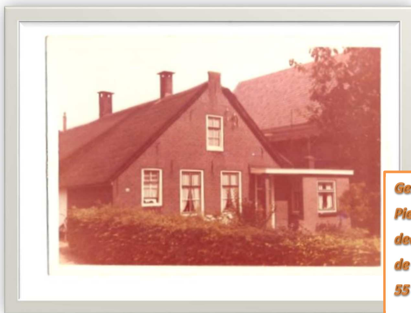
Geboortehuis van Piet, geboren op 22 december 1918 op de Lopikerweg oost 55 te Lopik

Toen de Overste met de bezetting van het eiland capituleerde, bleek het niet mogelijk de kustbatterijen aan de zuidwestkust van het eiland te bereiken. De bemanning van deze batterijen, waaronder zich